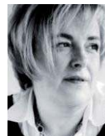
di Tiziana Colombo

Esistono grassi, meglio noti come grassi insaturi, che, se ben dosati nella nostra alimentazione, risultano benefici per la nostra salute. Pensiamo a quelli contenuti nella frutta secca ad esempio, o nell'olio extravergine di oliva. E che dire degli zuccheri? Noti per la loro cattiva reputazione, anch'essi non sono tutti uguali. Gli zuccheri della frutta e quelli contenuti in pasta e pane, ad esempio, rappresentano una buona e sana fonte di energia per il nostro organismo e che nulla hanno a che vedere con quelli "distruttivi" contenuti nelle bibite gasate.